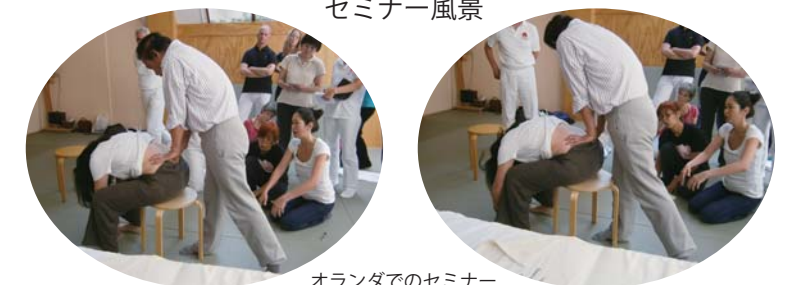
オランダでのセミナー